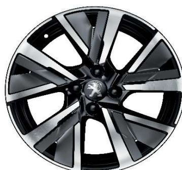
CAMDEN 17" GT