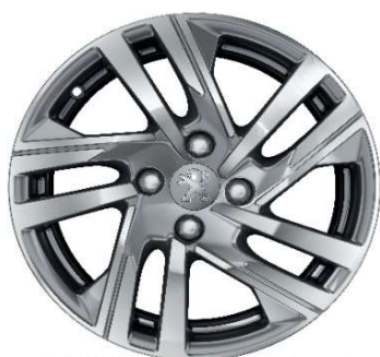
TAKSIM 16" Active Pack