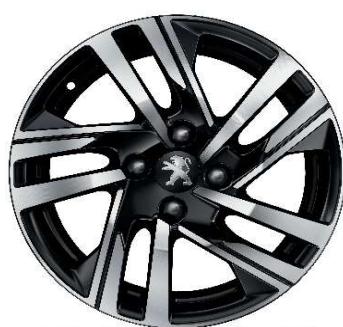
SOHO 16" Allure Pack