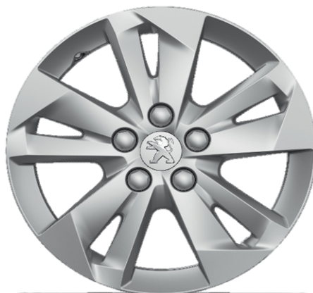
TARANAKI 15" Allure